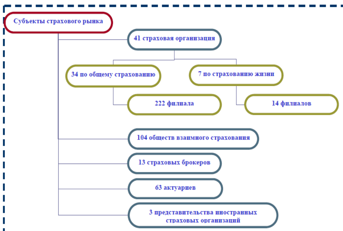
Рисунок 2 - Институциональная структура страхового сектора